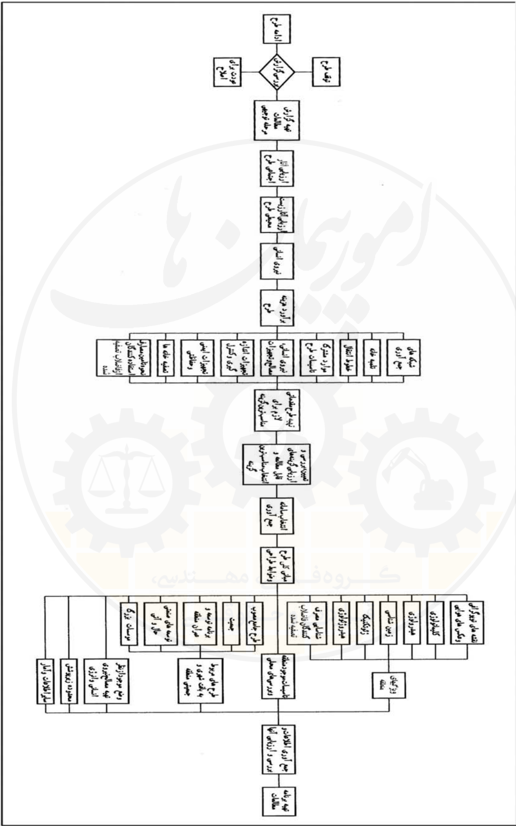
نمودار شماره ۱ - فهرست فعالیت‌های اصلی و نحوه ارتباط آن‌ها در مرحله توجیهی طرح‌های فاضلاب و آب‌های سطحی